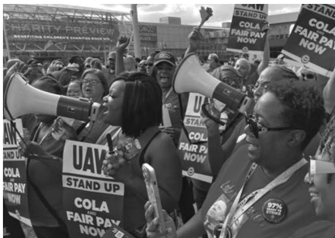
Arbeiter vom Ford-Werk in Louisville bei UAW-Streik- Kundgebung, Detroit, 15. September

Die Bosse haben die Autoindustrie ausgeschlachtet und die Arbeiterschaft dem Untergang ausgeliefert. Seit Jahrzehnten ist die Bevölkerung in den ehemals großen Industriestandorten stark zurückgegangen und die Armutsquote in die Höhe geschossen. Die verbliebenen Arbeiter leben in verfallenden Städten, arbeiten in längeren Schichten unter immer gefährlicheren Bedingungen, während die Reallöhne stagnieren und sinken. Arbeitsplatzverlust und Deindustrialisierung haben Metropolen des Mittleren Westens wie Detroit und Flint zerstört und das Leben für die mehrheitlich schwarze Bevölkerung zur Hölle gemacht.