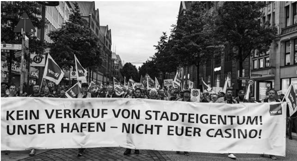
Hafenarbeiter protestieren in Hamburg am 19. September gegen weitere Privatisierungsmaßnahmen

liberale Fassade von Scholz und Baerbock und operiert dagegen mit offenem Chauvinismus. Während die AfD die Deindustrialisierung und die Angriffe auf die Renten kritisiert, steht sie genau wie die kapitalistische Ampel-Regierung für die Herrschaft der deutschen Banken und Bosse von VW, BASF und Siemens. Deshalb ist ihr Programm auch vollkommen reaktionär für die Arbeiterklasse.